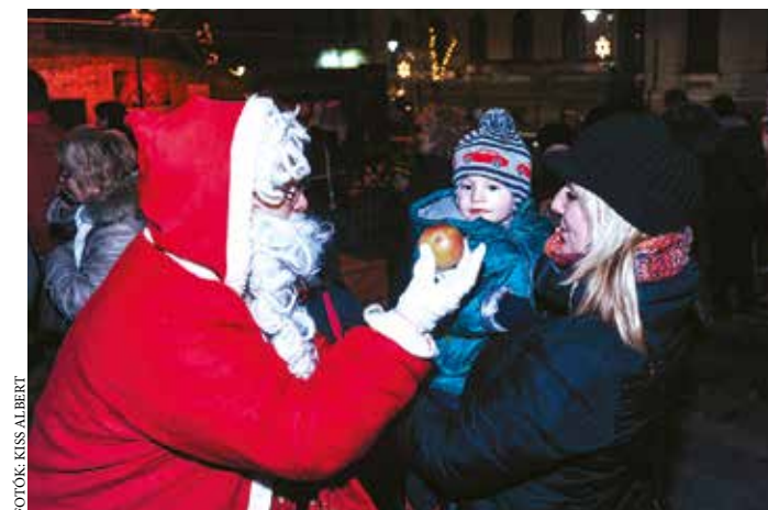
FOTÓK: KISS ALBERT