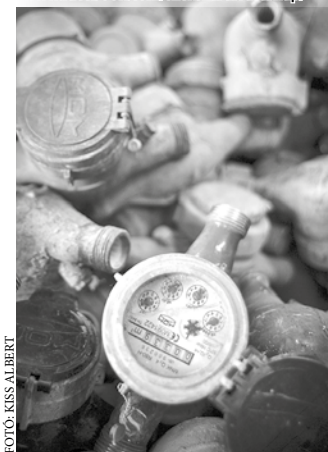
Keresse képgalériánkat facebook oldalunkon: www.facebook.com/szekszardivasarnap/

A legtöbb gond Fadd, Tolna, Kajdacs és Sióagárd térségében