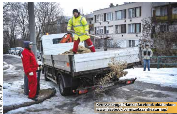
Keresse képgalériánkat facebook oldalunkon: www.facebook.com/szekszardivasarnap/

A megyeszékhely útjainak gépi síkosság mentesítését évek óta az Alisca Terra Nkft. végzi. Az önkormányzat közmű cége hónapokkal ezelőtt felkészült az idei tél kihívásaira.