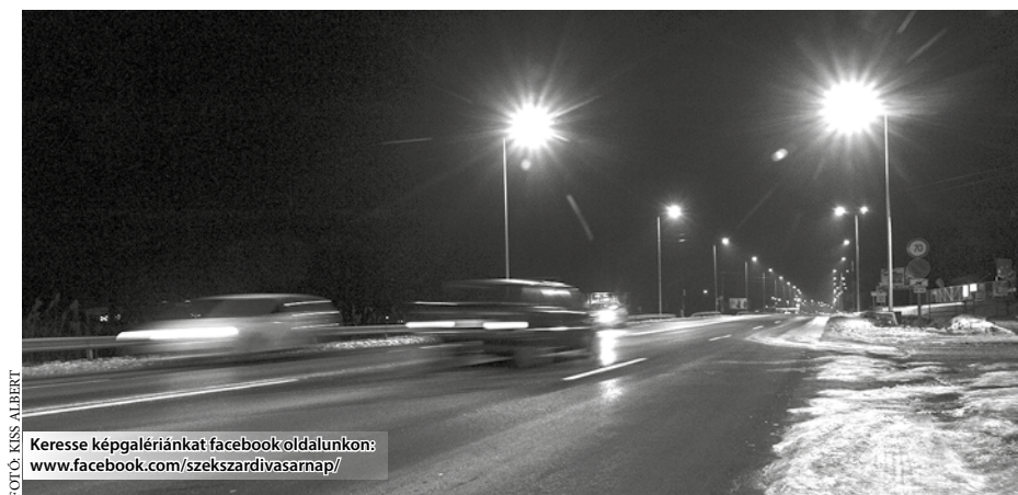
Keresse képgalériánkat facebook oldalunkon: www.facebook.com/szekszardivasarnap/

A város északi részén, az 56-os út bevezető szakaszán 61 lámpatestet üzemeltek be, így az itt működő vállalkozások dolgozói a nappali időszakon kívül is nagyobb biztonsággal közelíthetik meg munkahelyeiket. Ennél is több, összesen 150 új ledes fényforrást állítottak szolgálatba a megyeszékhely