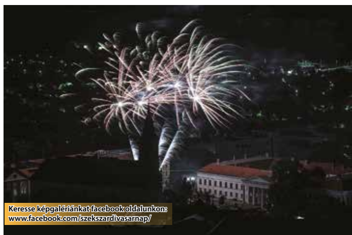
Keresse képgalériánkat facebook oldalunkon: www.facebook.com/szekszardivasarnap/