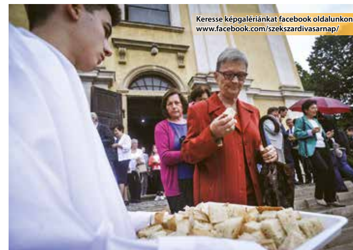
Keresse képgalériánkat facebook oldalunkon: www.facebook.com/szekszardivasarnap/