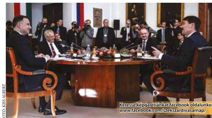
Keresse képgalériánkat facebook oldalunkon: www.facebook.com/szekszardivasarnap/

A tolnai megyeszékhely „modernkori” történetének legmagasabb szintű diplomáciai eseménye zajlott október 13-án és 14-én, amikor a visegrádi országok – Csehország, Lengyelország, Magyarország és Szlovákia – államfői találkoztak Szekszárdon.