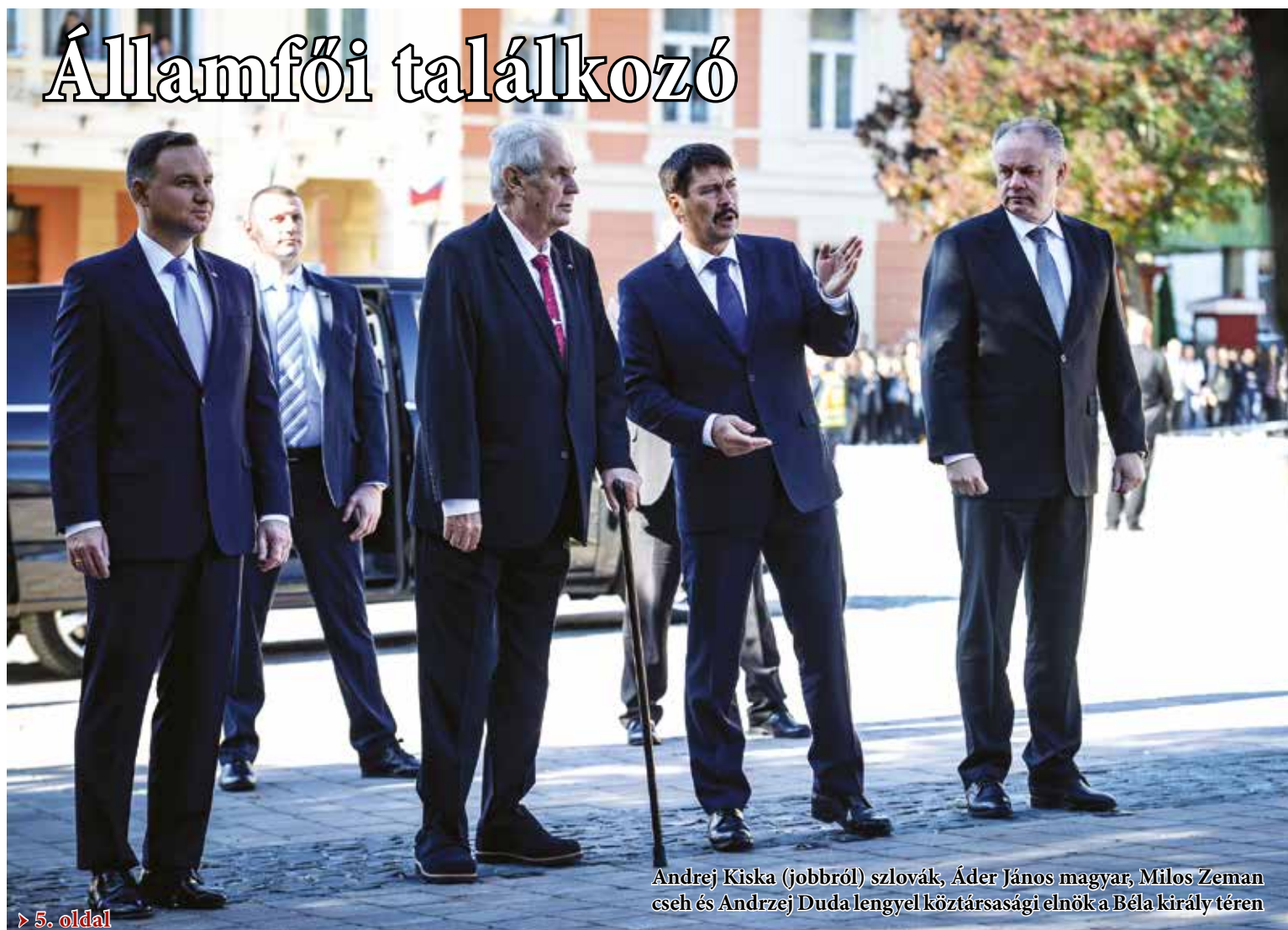
Andrej Kiska (jobbról) szlovák, Áder János magyar, Miloš Zeman cseh és Andrzej Duda lengyel köztársasági elnök a Béla király téren