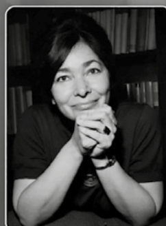
Fotó: Hunyady József 1964, forrás: Fortepan.hu

Helyszín: Babits Mihály Emlékház Szekszárd, Babits u. 13.