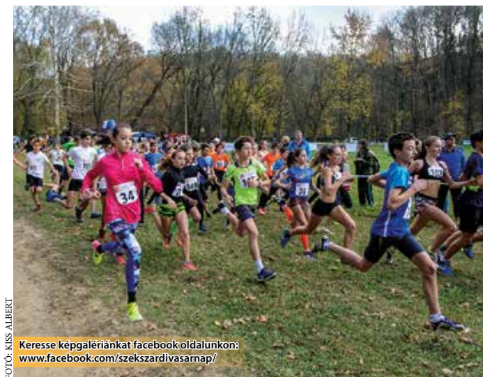
Keresse képgalériánkat facebook oldalunkon: www.facebook.com/szekszardivasarnap/

Az égiek figyelemmel voltak a november 11-én Sötétvölgyben megrendezett Twickel Szőlőbirtok Kupára – ami egyben a Mezei Futó Magyar Liga 2. állomása volt –, hiszen remek időben állhatott rajthoz a 259 résztvevő. Az évtizedes múltra visszatekintő verseny – melyet a Sportélmény Alapítvány a Szekszárdi Sportközponttal karöltve szervezett – országos népszerűségnek örvend, ezt bizonyítja, hogy Tatabányáról, Salgótarjánból, Gyuláról és még Debrecenből is érkeztek versenyzők.