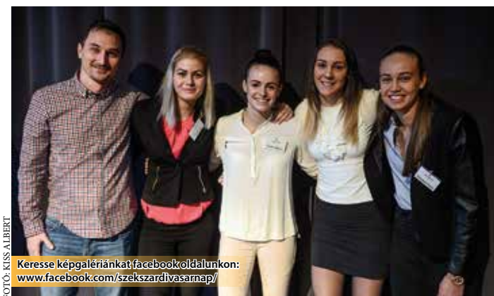
Keresse képgalériánkat facebook oldalunkon: www.facebook.com/szekszardivasarnap/

A zsúfolásig telt Rendezvényteremben helyet foglalókra tekintve Ács Rezső polgármester elmondta: jó körülmény, mert ez a magas létszám azt jelenti, hogy Szekszárdon sok tehetséges gyermek, fiatal és felnőtt végzi „munkáját” eredményesen. A „Szekszárd Büszkesége 2017.” elismerésben részesülőkről elmondta: közülük sokan nemcsak a megyében, vagy az országon belül értek el kiemelkedő eredményt, hanem azon túl is. A polgármester kijelen-