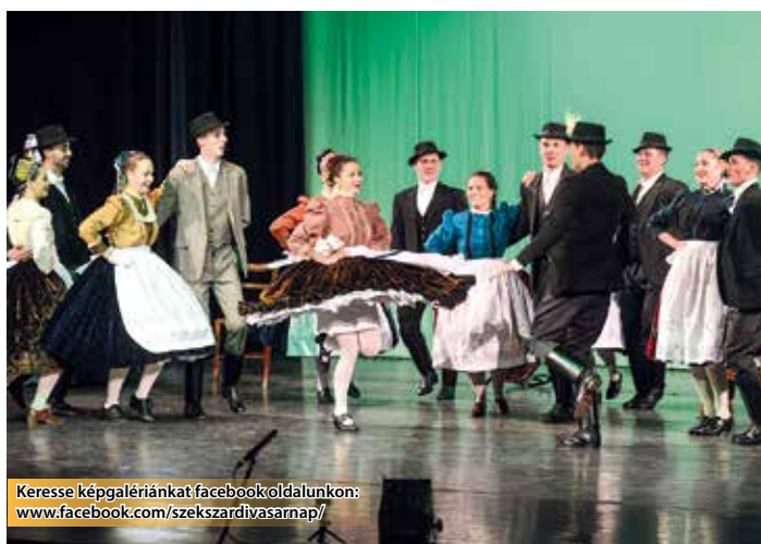
Keresse képgalériánkat facebook oldalunkon: www.facebook.com/szekszardivasarnap/