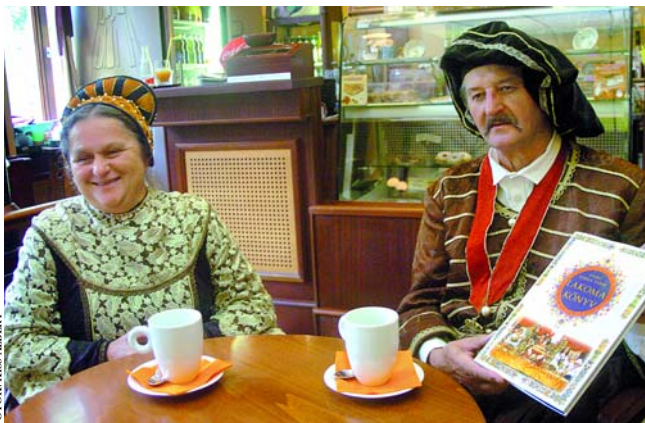
Vargák régi álma vált valóra a Lakomakönyvvel

– Sokan gratuláltak a könyvhöz. A férjem nagy álma vált valóra, s most vele örül az egész család. Már tervezgetjük a következőt, mert ennyi év munkája, tapasztalata azt bizonyítja számunkra, hogy nem elég a pillanatnak dolgozni, érdemes az utókornak is megmutatni azt, ami nemcsak számunkra, de hiszszük, hogy mások számára is szemet és szívet gyönyörködtető élményt szerez.