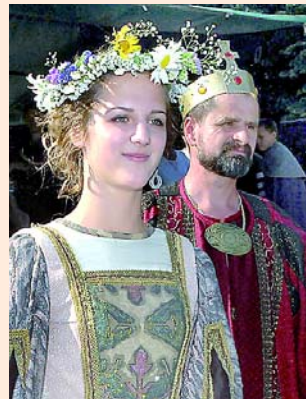
A király és első udvarhölgye

kok szerepében”, valamint „a város felvilágosító, megvilágosító és nem utolsósorban kivilágosító pilácsnokai” képében nyújtották át ajándékaikat a királyi párnak, mely adományokat aztán a „királyi főkamarás” gondosan össze is gyűjtötte. Miután a „város mankó- és piócagyűjtő gondoznokai”