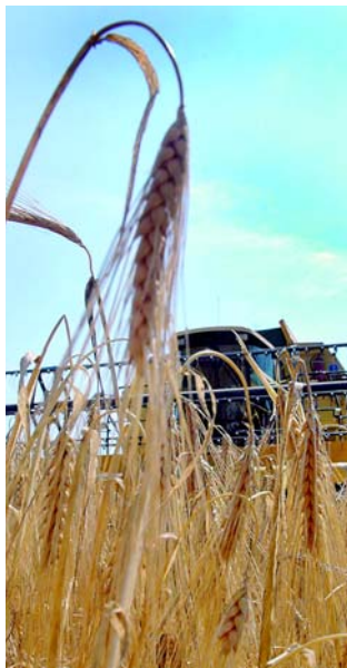
Befejeződött az aratás

Gabonatermesztés: a kiválás taktikája lehet a nyerő