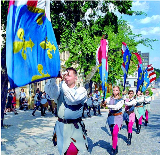
A zászlóforgatók látványos műsorral szórakoztatták a közönséget