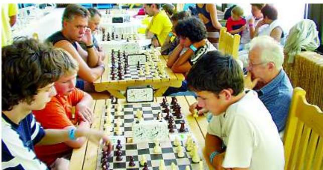
Közel negyvenen ültek asztalhoz az első Strandkupán

A szellemi sport után a sakkozók felfrissülésként a megújult uszodában vízi kosár- és röplabdacsatákban vettek le a verseny izgalmait.