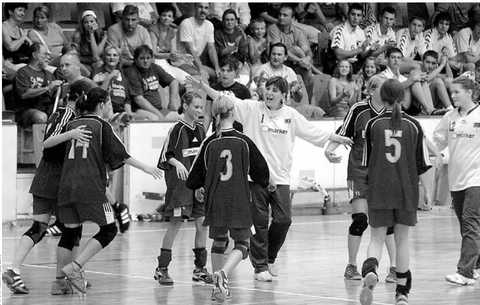
Az UKSE Székszárd 1992-93-as korosztályú csapata tornagyőzelmet ünnepelhetett