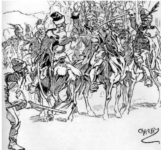
Diadalt arató kurucok (Garay Ákos rajza)

„rác ellenségen egy nevezetes csapat tegyen”. Esterházy gyanítja, hogy a kuruc vezérek közti civakodás miatt nincs összehangolt támadás, ezért Béri Baloghot még áristommal is fenyegeti, majd Pécs elfoglalására utasítja, akár a vár felgyújtása árán is. A címzett kereste, de nem találta az ellenséget, végül fáradt hadaival visszavált Simontornyára.