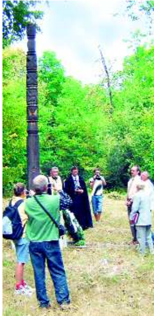
„Emlékezzünk!” Áhítat a bunyaszekszárdi temetőben