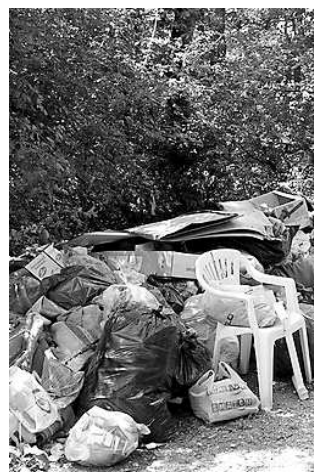
Illegális és környezetszennyező

Érthető tehát, hogy mindannyiunk érdeke, hogy a meglévő illegális lerakók felszámolására kerüljenek, újabbak ne jöhessenek létre. A Hulladék-kommandó ezért dolgozik, de mi magunk is sokat tehetünk érte, ellene. F. L.