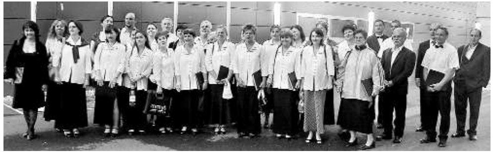
A Szekszárdi Gárdonyi Zoltán Református Együttes az egyik fellépés után

Felvételizni lehet az 1-2. és az 5-6. évfolyamra.