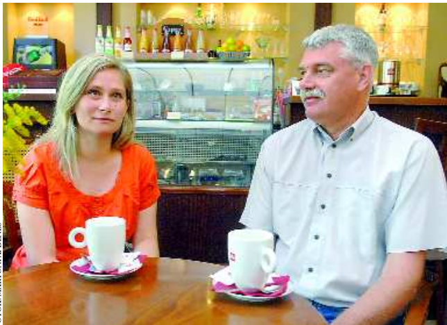
Családok, gyerekek problémáin igyekeznek enyhíteni