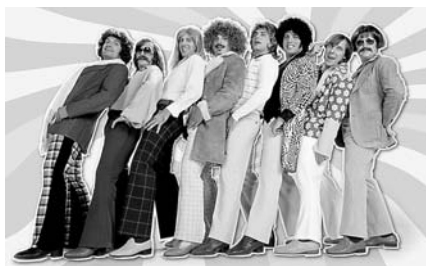
A mirigyek a művelődési házban mulattatnak