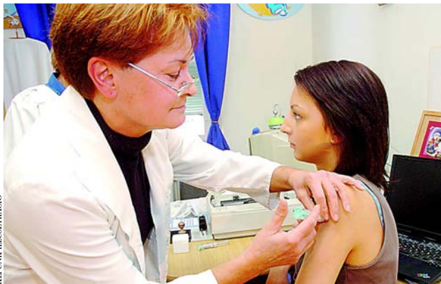
A HPV-vírus elleni védőoltást az egészségbiztosító nem támogatja

- Egyedül ez az a szűrés, amely nagy biztonsággal korai állapotban kimutatja a rákot és a rákot megelőző állapotokat. E betegségnek hosszú, 10-15 éves lefolyási ideje van, ezért a korán felfedezett esetek szinte száz százalékosan gyógyíthatóak. Az utóbbi évek nagy-