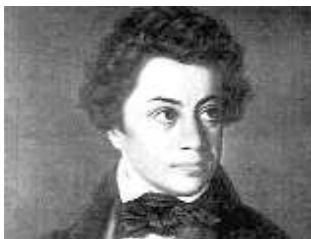
Julius Mosen (1803 - 1867)

A Robur álnév nem sokáig maradt az, mert az újság – némi túlzással és indiszkrécióval – ezt írta hozzá jegyzetben: „E név alatt – bizalmasan megsgújk olvassóinknak – Babits Mihály volt