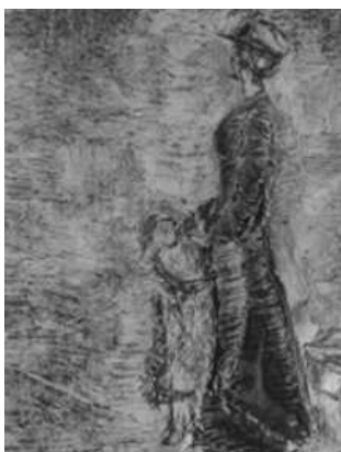
A Wass-pályázat III. díjas alkotása

Beszélhetnénk elrendelt vargabetűről, például bordszalműves szakmájáról. Arról, hogy édesapja – a megyei múzeum restaurátora – a legfőbb szakmai tanácsadója. Az alkotóról, aki polgári hivatásából kíván megélni, és „földalozza” talentumát. Aki vér és arany vezérelte világegyetemünkben hazai és külföldi tanulmányutak, alkotótáborok helyett kénytelen beérni a pályázatok nyújtotta lehetőségekkel. A kezdetben autodidakta módon,