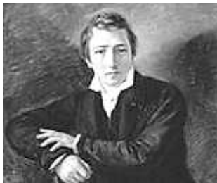
Heinrich Heine (1797 - 1856)

De mi van a regényben emlegetett Heine-fordítással? A Szekszárdi Vidék 1898. szeptember 10-i 4. oldalán találjuk.