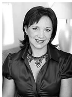
Sebestyén Márta a belvárosi katolikus templomban ad koncertet vasárnap délután