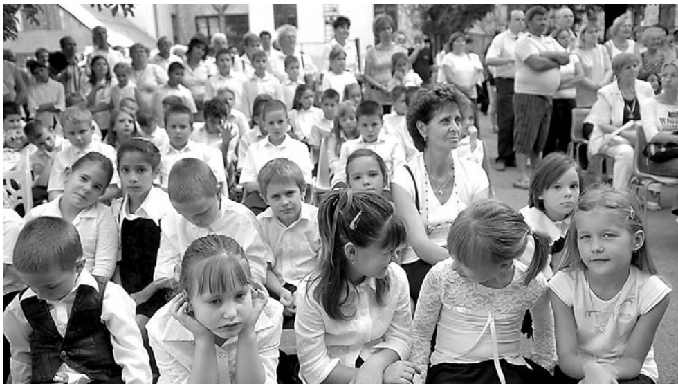
A katolikus iskolában huszonkét elsős kisdíák kezdte meg tanulmányait

Felavatták a Szent József Katolikus Általános Iskola új épületét