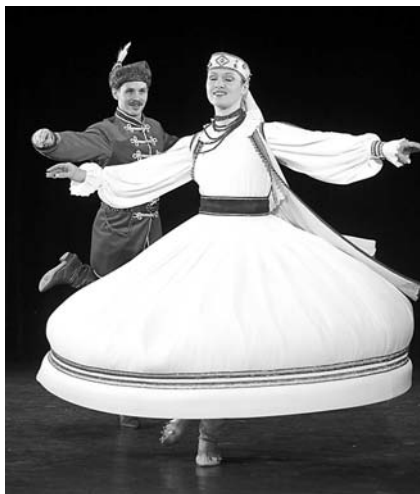
A Magyar Állami Népi Együttes is színpadra lép