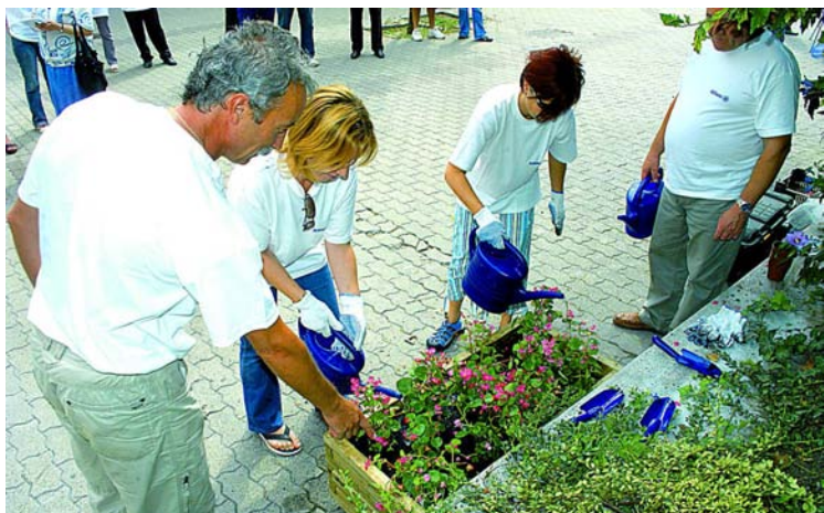
Virágot is ültettek a szekszárdi fiók munkatársai

adott önkormányzatokkal egyeztetve szépítették a parkokat, tereket, természetesen a bankfiókhoz közeli helyeken. A szeptemberben indult „Miben segíthetünk?” társadalmi felelősségvállalási akció keretében városunk is gyarapodott egy kellemes telt terecskével. A munka végzetével egy kis réztáblát – reméljük, még megvan! – is kihelyeztek, jelezve, hogy az Allianz varázsoltá kellemessé a kis teret, ahol megpihenhetnek a városlakók és romantikázhatnak a fiatalok. Reméljük, hogy a bankosok remek ötlete követőkre talál. hm - bj